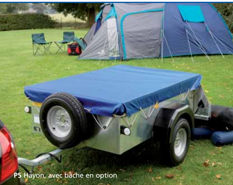
P5 Hayon, avec bâche en option