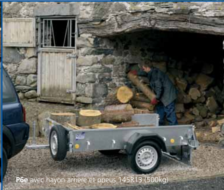
P6e avec hayon arrière et pneus 145R13 (500kg)