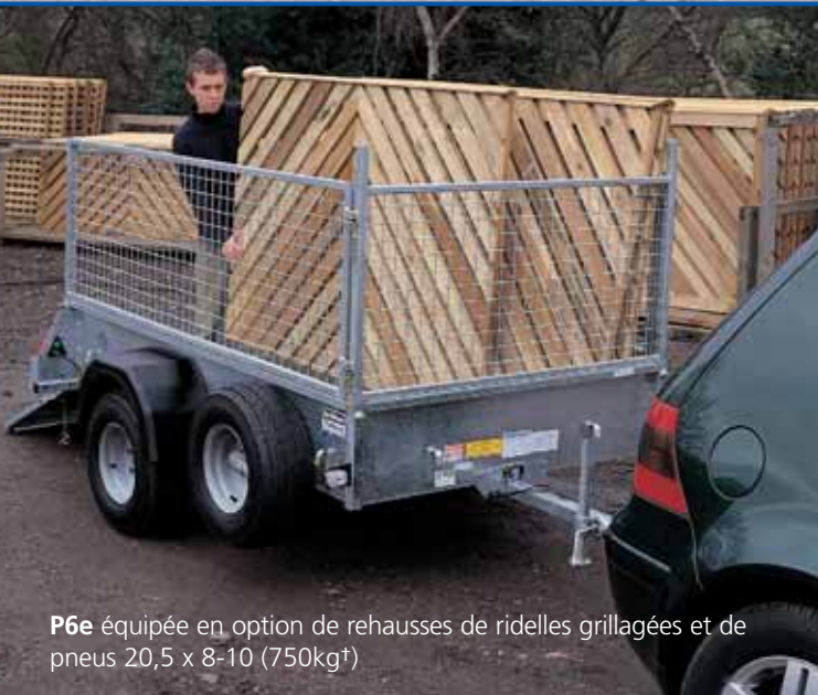
P6e équipée en option de rehausses de ridelles grillagées et de pneus 20,5 x 8-10 (750kg†)