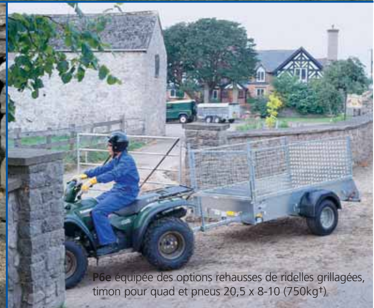
P6e équipée des options rehausses de ridelles grillagées, timon pour quad et pneus 20,5 x 8-10 (750kg†)