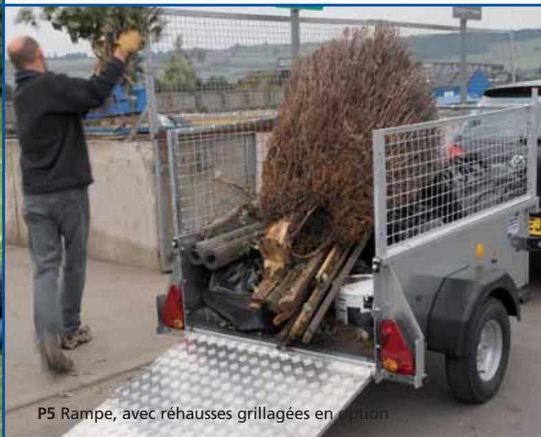
P5 Rampe, avec réhausses grillagées en option

Et voici la P5, la dernière née de notre gamme de remorques non freinées. La P5 est une remorque compacte et pratique, conçue pour un usage privé ou professionnel léger. Plus robuste que toutes les remorques de sa taille, la P5 répond aux standards de nos remorques professionnelles. Elle vous rendra service pendant de nombreuses années, beaucoup plus longtemps que les petites remorques fragiles du marché.