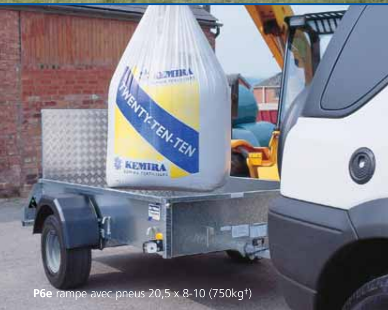
P6e rampe avec pneus 20,5 x 8-10 (750kg † )

† Les remorques de 750 Kg de P.T.A.C. ne sont pas homologuées pour la circulation routière en France. Voir poids à vide en dernière page.