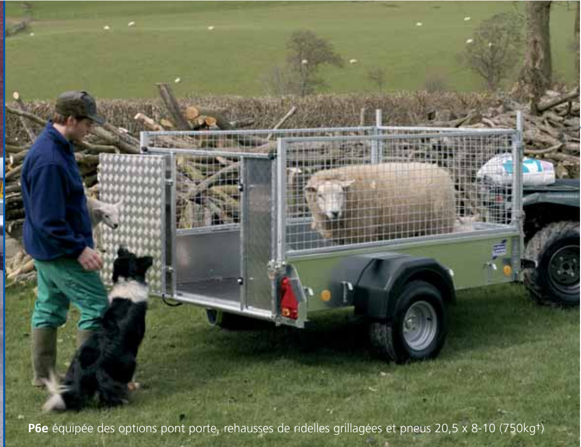
P6e équipée des options pont porte, rehausses de ridelles grillagées et pneus 20,5 x 8-10 (750kg†)