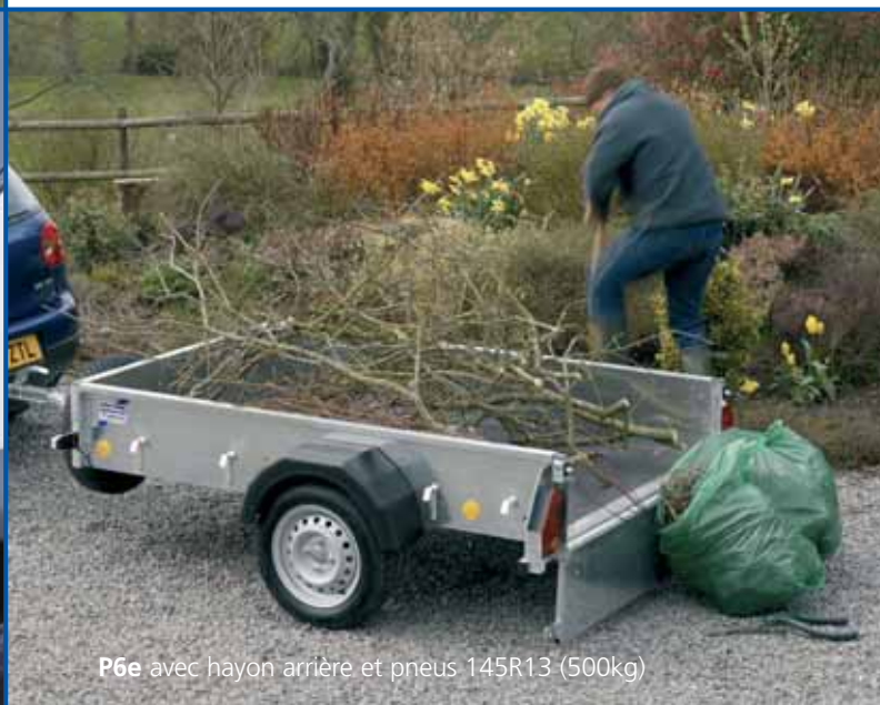
P6e avec hayon arrière et pneus 145R13 (500kg)

Plus grandes et plus robustes que les remorques vendues habituellement dans votre magasin de bricolage ou dans les centres automobiles, les P6e et P7e sont des petites remorques au grand cœur. Sur la route, elles peuvent être tractées par une berline familiale 1 , hors route, elles peuvent même être tractées par un quad. 2 En version rampe ou hayon arrière, avec l'option hard top ou bétailière, avec des P.T.A.C. de 500 Kg ou 750 kg † et toute une gamme d'accessoires, les P6e et P7e répondent aux besoins des particuliers, des professionnels et des agriculteurs.