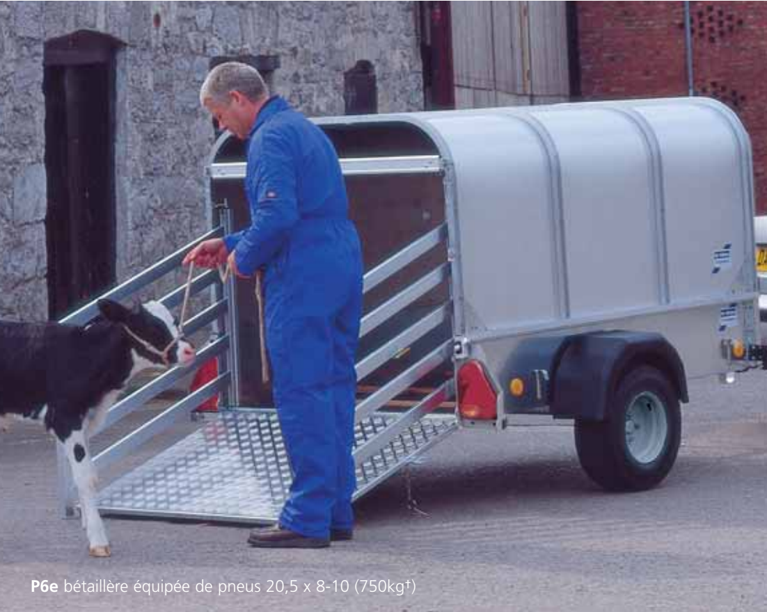
P6e bétailière équipée de pneus 20,5 x 8-10 (750kg†)