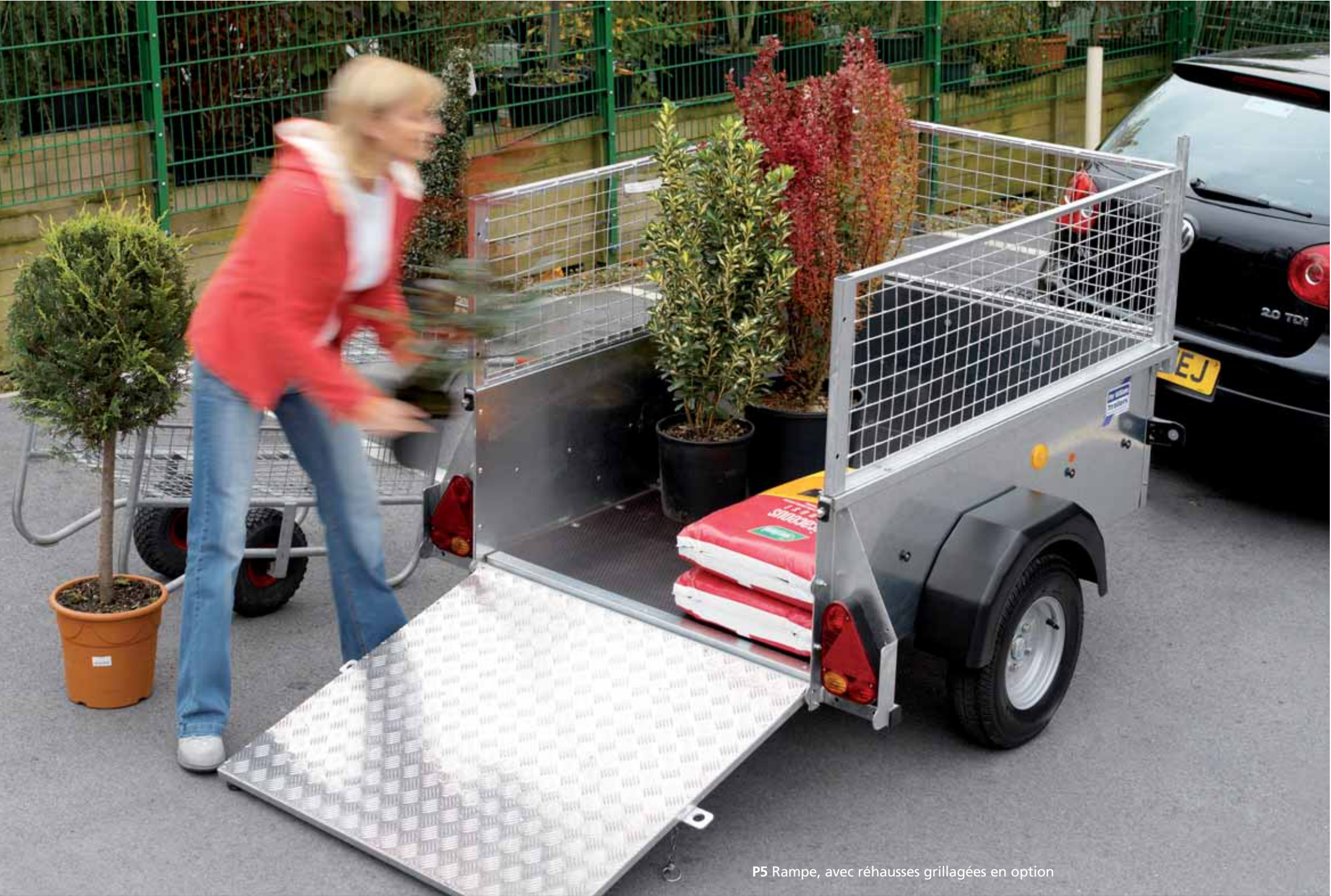
P5 Rampe, avec réhausses grillagées en option