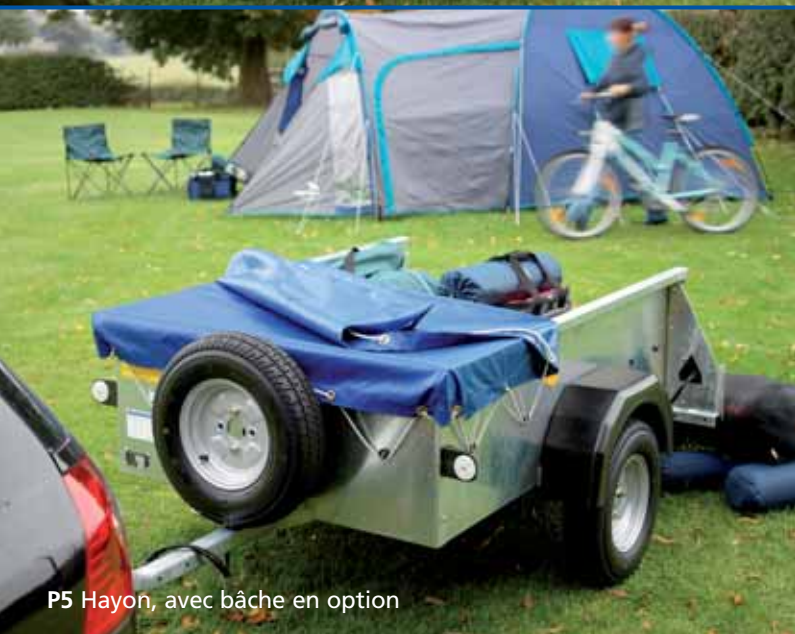
P5 Hayon, avec bâche en option